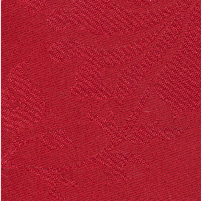
9900 Ulldamask 601